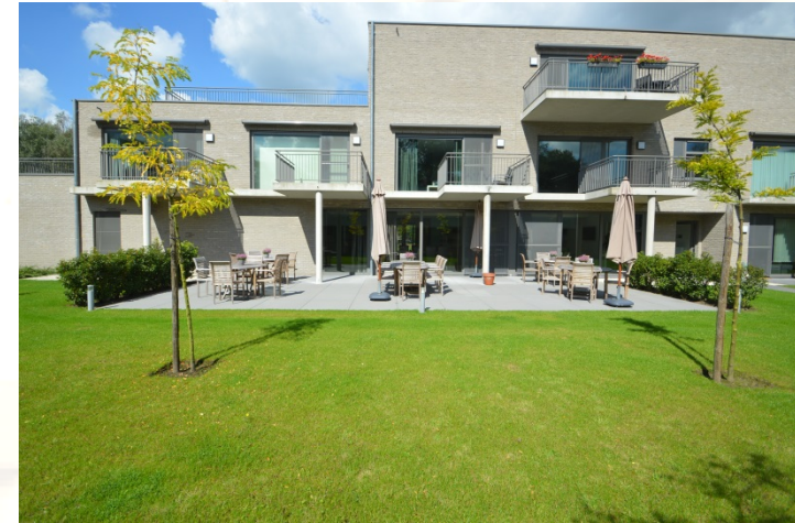
Aanzicht vanuit de binnentuin

Blok A bestaat uit 3 verdiepingen met op het gelijkvloers de gemeenschappelijke ruimte.