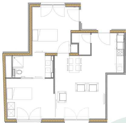
Grondplan van een rusthuisappartement